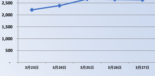
TOCOM プラチナ先物価格 (円/グラム)

TOCOM プラチナポジション 13,904,000 グラム 先週同比 減少 1,404,000 グラム