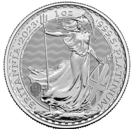
2023ブリタニアプラチナ地金コイン1オンスの裏面

「ブリタニアは我々が最も誇りとし歴史の長いデザインのひとつで、コインの美しさを保ちながら新しい高度な偽造防止技術を加えることが重要だった。金属の自然な反射と新技術を駆使し、我々は信頼性も安全性も非常に高い比類のないコインを作り出した。」